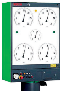
Pokaznik uređaja za ispitivanje kočnica vozila