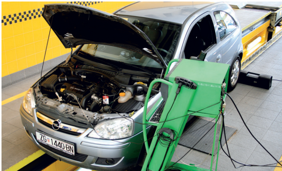
Ispitivanje ispušnih plinova